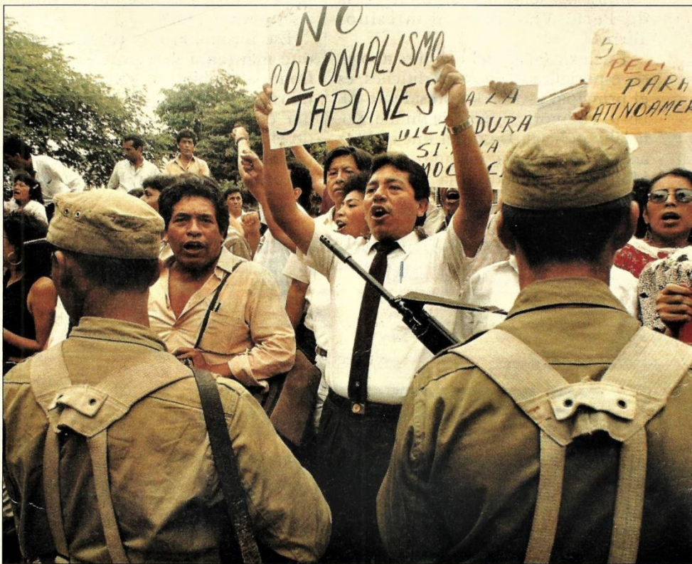
Para un sector de la población, hoy en Perú existen demasiados poderes en la sombra.